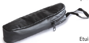
Etui en similicuir ORA-A2103