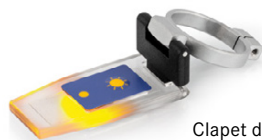
Clapet de prisme avec LED ORA-A1101